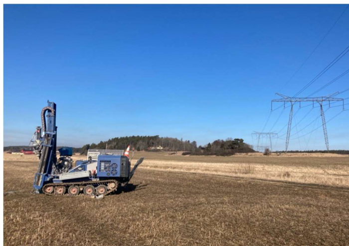
Bild 2: Borrbandvagn som används vid geotekniska markundersökningar