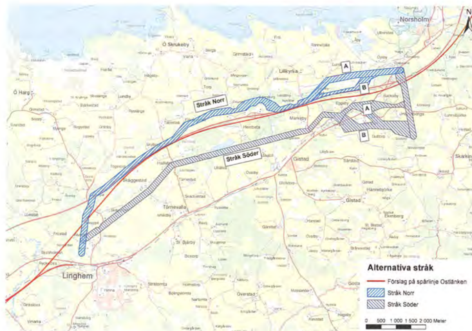
Bild visar de två stråken som redovisas i samrådsunderlaget.

Samrådsunderlaget har granskats av tjänstepersoner inom Översiktsplaneavdelningen, Plankontoret, på Miljö- och samhällsbyggnadsförvaltningen. Kompetenser som deltagit i granskningen är översiktsplanerare, miljöskyddsinspektör, stadsantikvarie och kommunekolog.