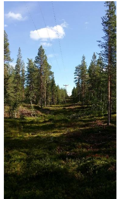
Figur 3. 20 kV luftledning i lokalnätet, ej trädsäker.