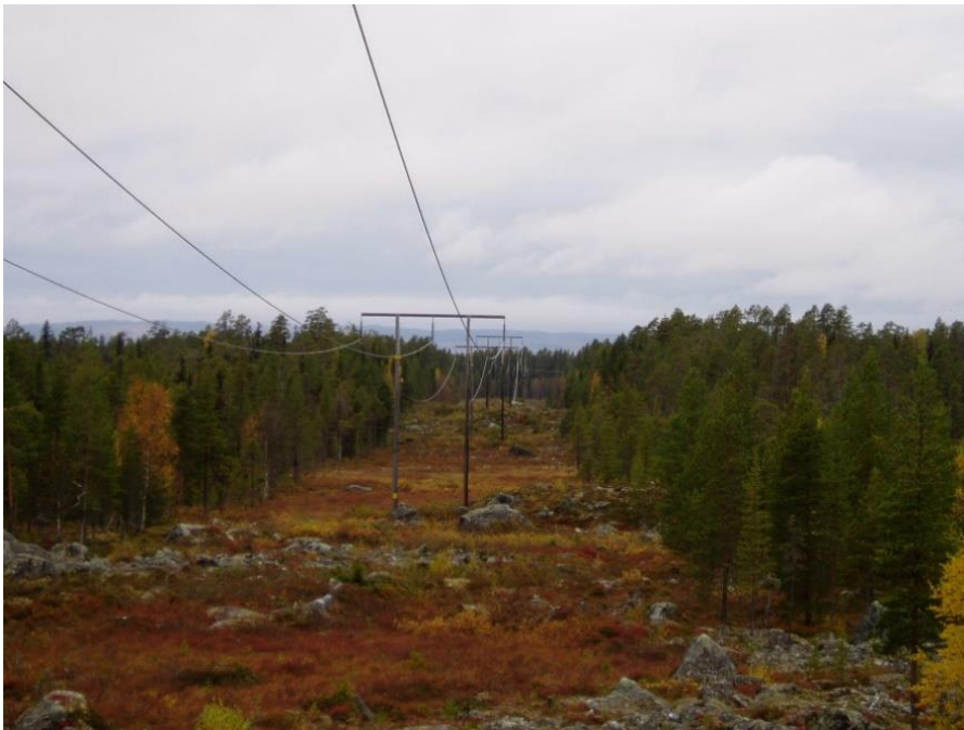
Figur 2. 130 kV luftledning i regionnätet, trädsäker.

När en ny kraftledning planeras inom regionnätet så domineras samrådet ofta av krav på att den ska byggas som markförlagd kabel. Det är naturligt att så är fallet då en markförlagd regionnätsledning tar mindre mark i anspråk och inte medför någon visuell påverkan jämfört med en trädsäker luftledning i en cirka 40 meter bred skogsgata. Eftersom markförläggning av befintliga luftledningar pågår i stor omfattning för lokalnätsledningar, med lägre spänningsnivå, är det fullt förståeligt att det finns en uppfattning att markförläggning av större regionnätsledningar kan ske i samma omfattning. Så är inte fallet utan de tekniska utmaningarna med markförläggning av kraftledningar ökar med stigande spänningsnivå.